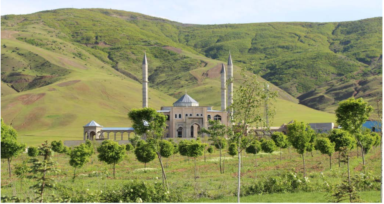
Resim 4. Kampüs Cami

Türkiye Diyanet Vakfı tarafından yapımı üstlenilen Kampüs Cami'nin, inşaat çalışmaları devam etmektedir.