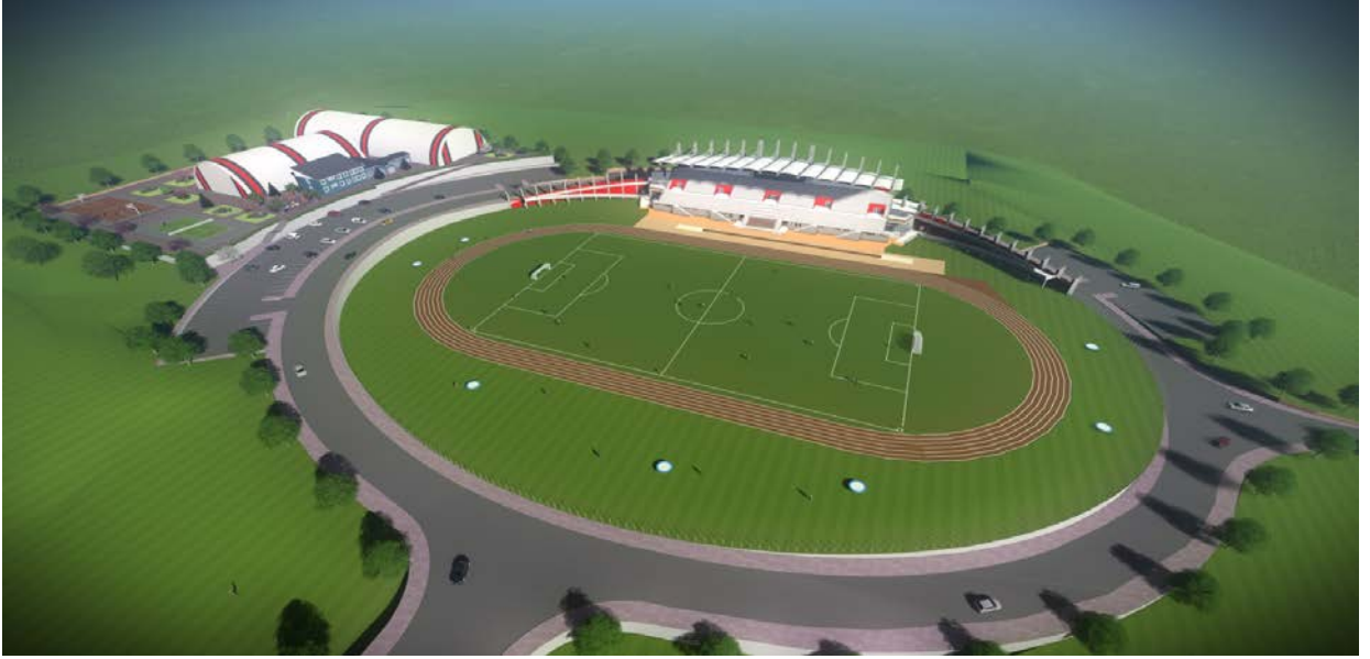
Resim 6. Açık Spor Tesisleri

“Açık ve Kapalı Spor Tesisleri” projesine baęlı olarak 2015 yılında yatırım programına dahil edilen “Açık Spor Tesisleri” projesi yapım işinin, 2017 yılında ihale çalışmalarına başlanması planlanmaktadır.