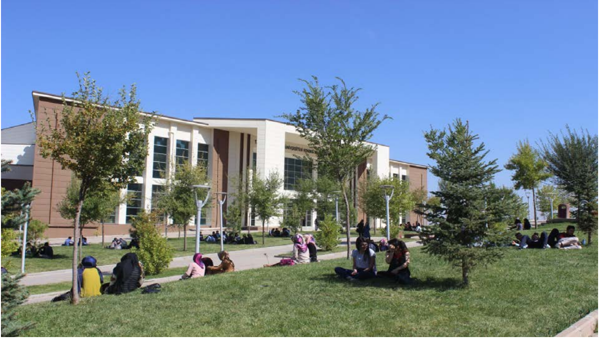
Resim 2. Kongre ve Kltr Merkezi