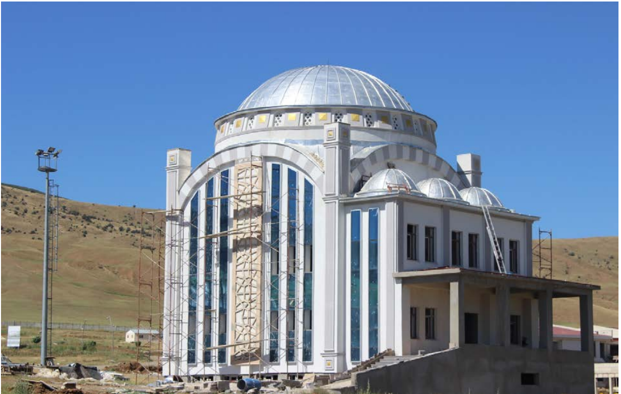
Resim 5. Gazze Cami

Türkiye Diyanet Vakfı tarafından yapımı üstlenilen Kampüs Cami'nin, inşaat çalışmaları devam etmektedir.