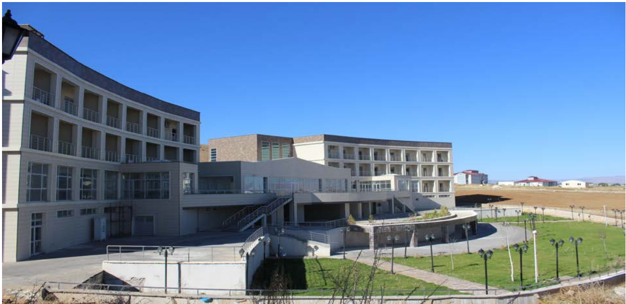
Resim 5. Konuk Evi

2013 yılında ihale süreci tamamlanarak yapımına başlanılan “Kongre ve Kültür Binası” yapım işi 2016 yılsonu itibari ile tamamlanmıştır.2013 yılında ihale süreci tamamlanarak yapımına başlanılan “Lojman (48 Daire) ve Sosyal Tesis(Konuk Evi)” yapım işi 2016 yılsonu itibari ile tamamlanmıştır.