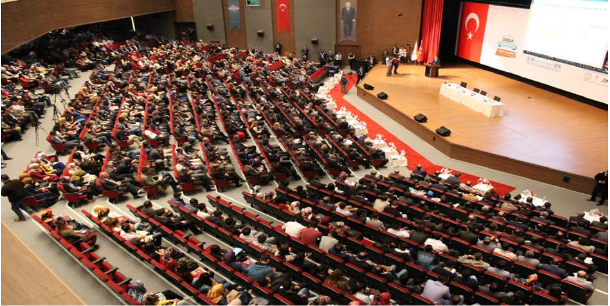
Resim 3. Kongre ve Kltr Merkezi (İ Grnm)