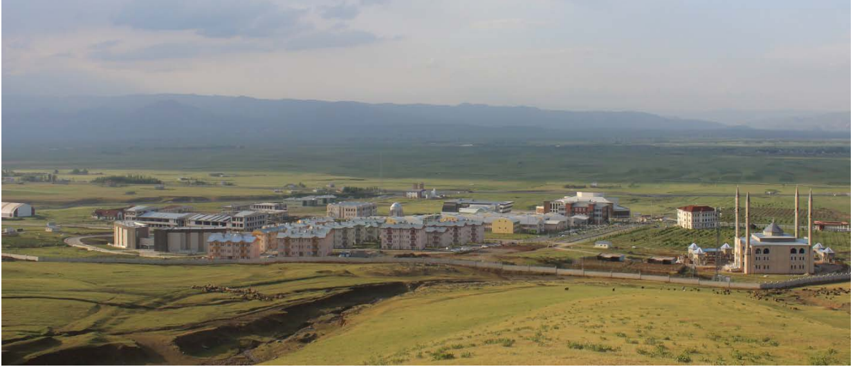
Resim 1. Kampüs Alanı